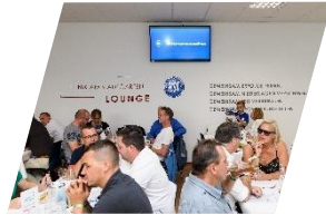
Klinik am Stadtgarten-Lounge