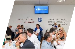
Klinik am Stadtgarten-Lounge