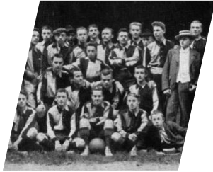
Gründung FC Phönix Karlsruhe