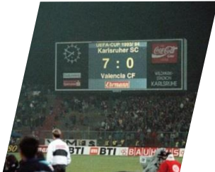
Das Wunder vom Wildpark