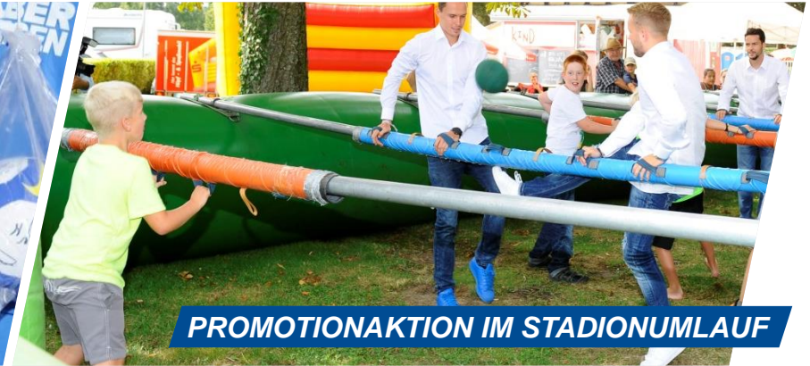
PROMOTIONAKTION IM STADIONUMLAUF