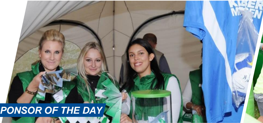
SPONSOR OF THE DAY