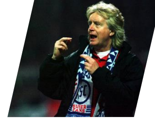
KSC qualifiziert sich für den UEFA-CUP