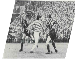
Gründungsmitglied der Bundesliga