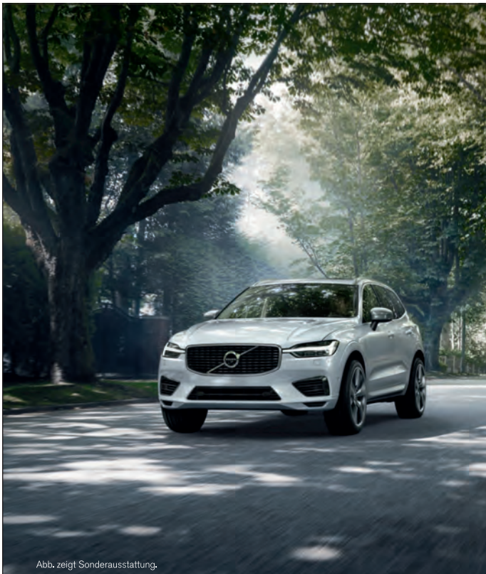
Abb. zeigt Sonderausstattung.